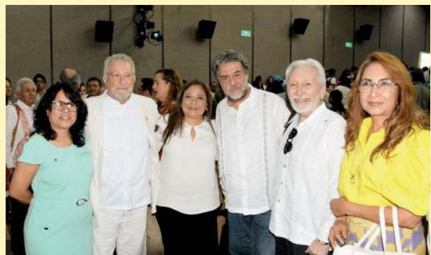
Asistentes al seminario "Programas de Financiamiento y Desarrollo de Proyectos Turísticos para el Mundo Maya".