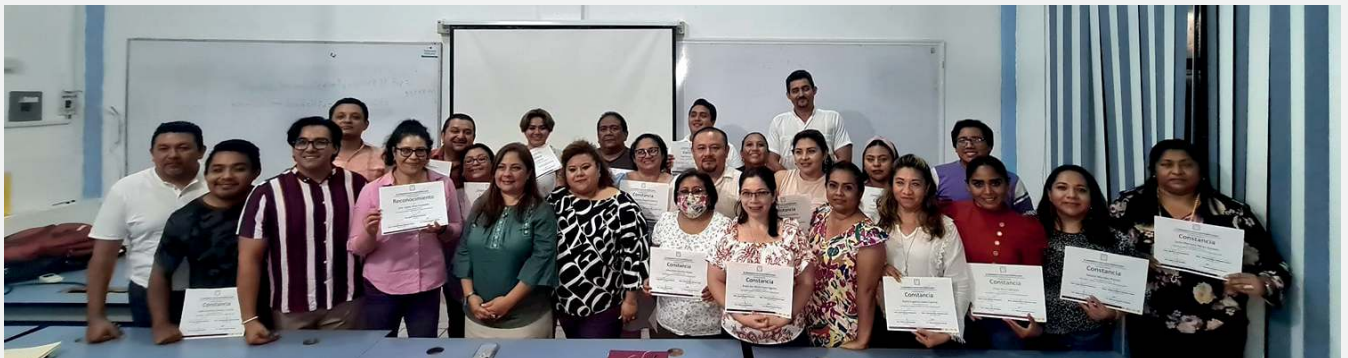
Docentes y autoridades presentes en la clausura del curso.