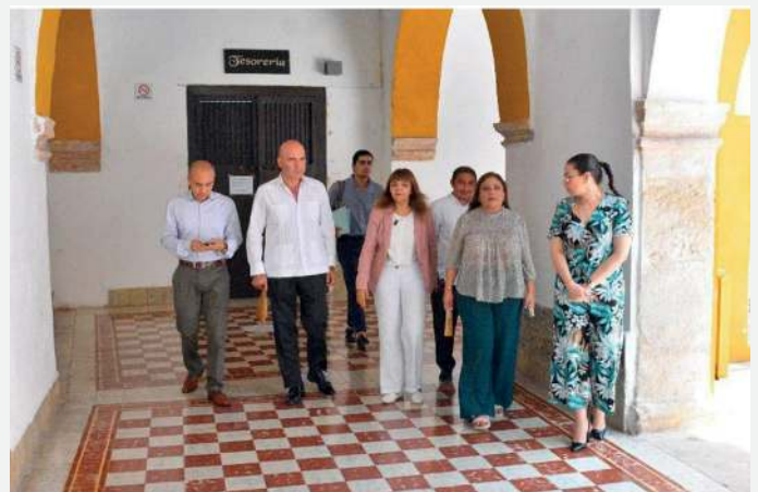
Recorrido por los pasillos del Claustro del I.C.