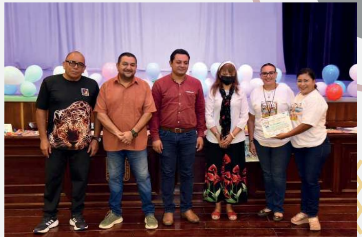
Direcciones participantes en el Curso de Verano.

Más de 40 niños que formaron parte del Curso de Verano 2023 presentaron en el Teatro “Ricardo Hernández Cárdenas” un magnífico espectáculo en el que dieron muestra de las habilidades adquiridas y además, expusieron los trabajos y obras de arte realizados.