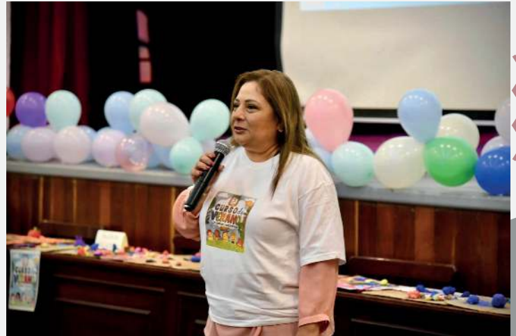
Rectora del I.C. durante su mensaje a docentes, alumnos y participantes del curso.