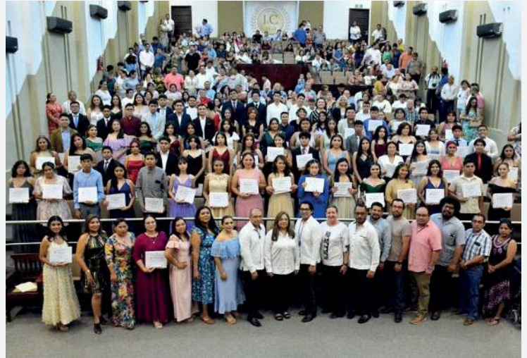
Ceremonia de graduación de la generación 2020-2023 celebrada el 12 de julio en el Teatro “Ricardo Hernández Cárdenas”.