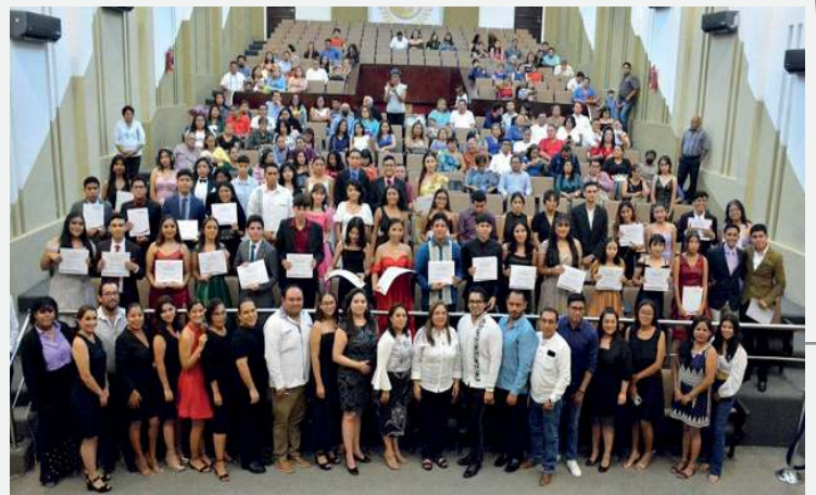
Ceremonia de graduación de la Preparatoria Vespertina “Prof. Ramón Berzunza Herrera”.