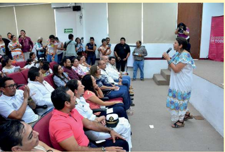
Clausura del Curso de Verano Inclusivo en su edición 2023.