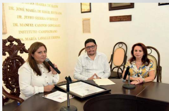
Palabras de presentación al Consejo Superior.