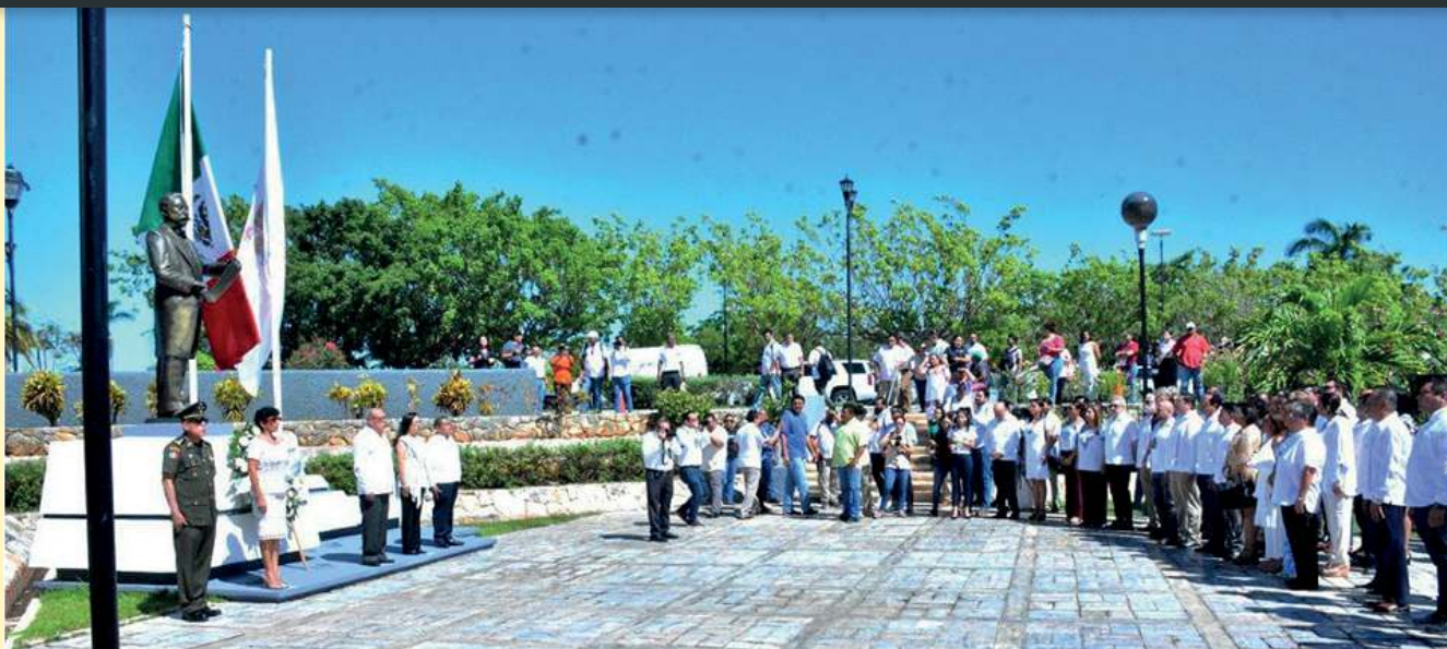
Guardia de honor y ofrenda floral ante el monumento a Pablo García y Montilla.