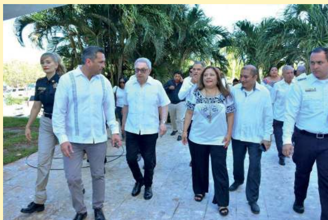
Asistentes a la ceremonia.