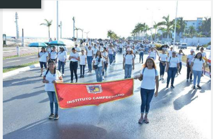
Contingente del Instituto Campechano, reunido en el malecón de la ciudad el 16 de junio.

El Instituto Campechano se sumó a la campaña nacional de prevención de adicciones "Si te drogas, te dañas" a través de un numeroso contingente de jóvenes, docentes y autoridades que caminaron sobre el malecón de la ciudad con carteles, pancartas, cuadros de selfie y actividades de activación física para incentivar a la población campechana a optar por una vida sana.