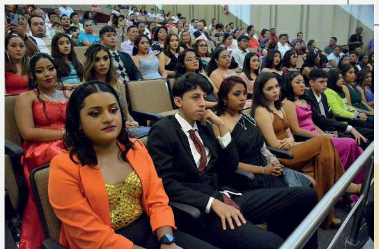
Generación 2020-2023 de la Preparatoria Vespertina.