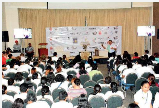
Conferencia magistral "Enfoques o rutas de la Investigación cuantitativa, cualitativa y mixta".