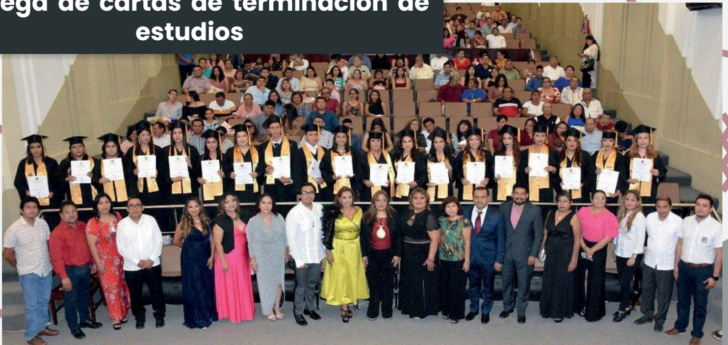
Ceremonia de graduación de la generación 2009-2023 de la licenciatura en Enseñanza y Aprendizaje del Español en Educación Secundaria de la Escuela Normal Superior "Profr. Salomón Barrancos Aguilar".