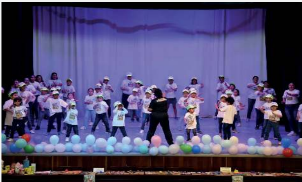
Demostración de activación física durante la clausura.