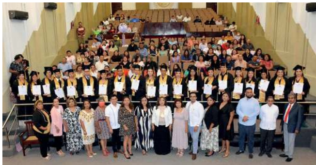
Ceremonia de graduación de la generación 2019-2023 de la Escuela Normal en Educación Primaria "Profra. Pilar Elena Flores Acuña".