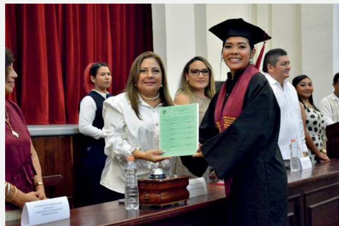
Entrega de cartas de terminación de estudios.